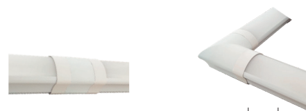
PWP-C6 CI I-обр.